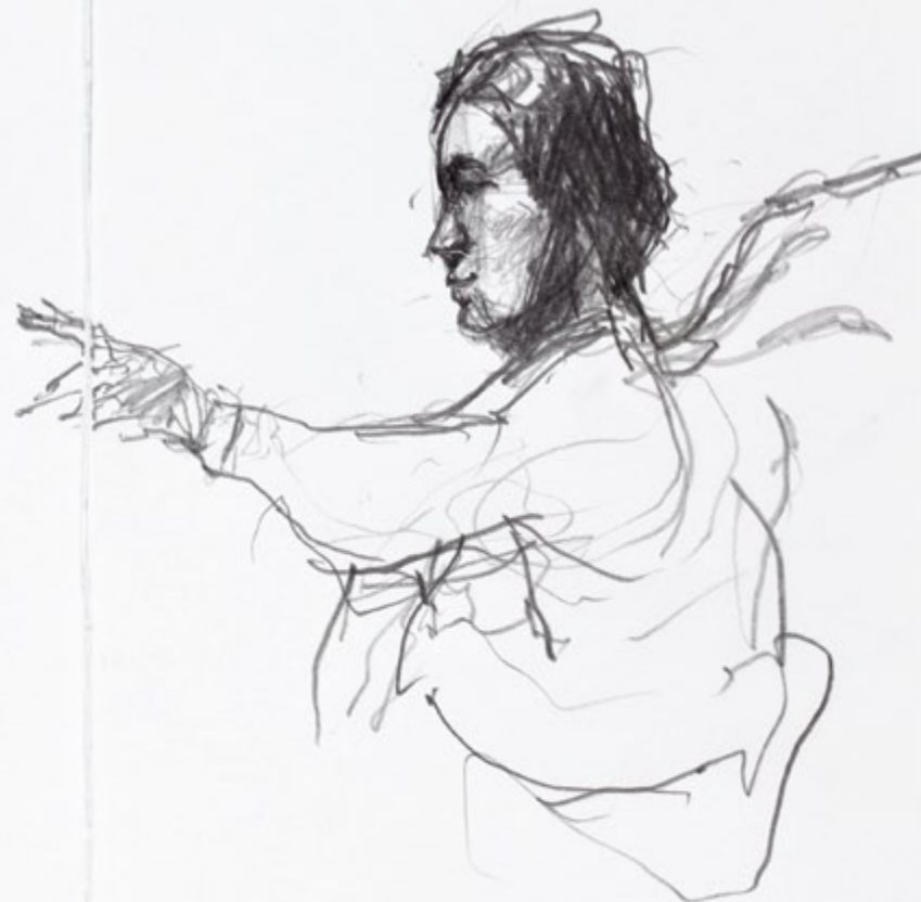
Mango , mine de plomb, 2009

Avant tout, je me considère dessinateur.