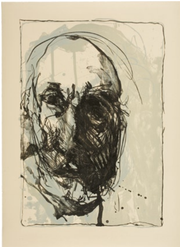
Florimond , litografie, 102 cm x 74 cm, 2009

Graficus en schilder KUUTTI LAVONEN (Finland, 1960) put zijn inspiratie grotendeels uit het Europees cultureel erfgoed: de Italiaanse renaissance en vooral de barok.