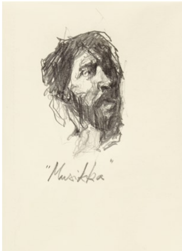
Musikka , mine de plomb, 2009

Ik beschouw mij in de eerste plaats als tekenaar.”